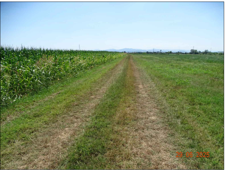
Foto 2 strada sterrata in prossimità della nuova cabina